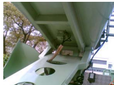
NHG 900 L