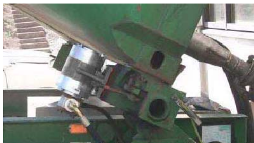
NHG 3000 L