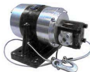
NHG 3000 L