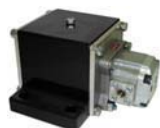
NHG 500 L