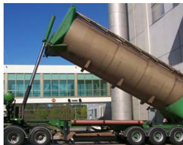
Vidage de véhicules-silos