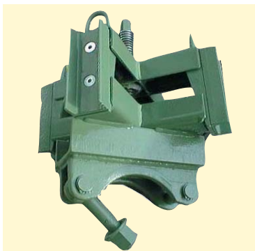
Spannkreuz mit Spindelverstellung