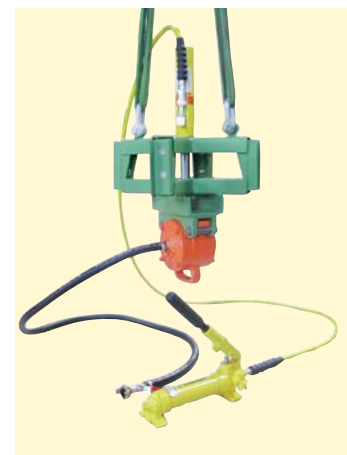
Spannkreuz mit Hydraulikzylinder