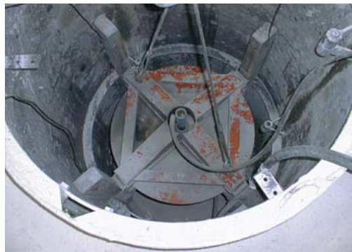
Ofenzustellung mit NKH