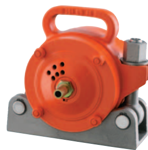
NVT 87 mit Halterung NVH 4