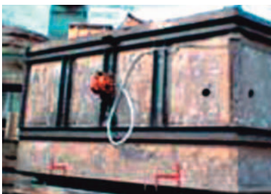
Verdichten von Formsand

Halterungen zu diesen Vibratoren finden Sie auf unserem Datenblatt.