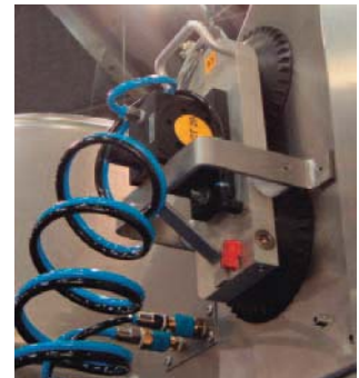
fixation mobile sur conteneur en inox