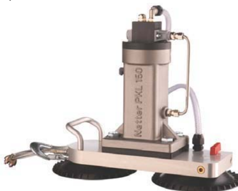
VAC 15 avec PKL 150 ST