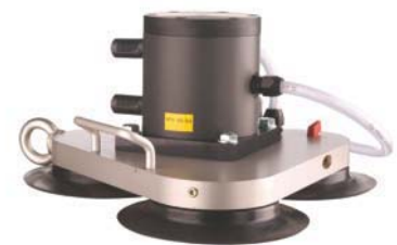
VAC 30 avec NTS 50/04